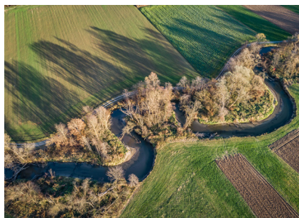
Abb. 5: Luftaufnahme der Lafnitz.

In Österreich besteht eine lange wissenschaftliche Tradition in den Fachbereichen Biodiversität und Wasser, beispielsweise limnologische Forschung seit fast 130 Jahren hinsichtlich Oberflächen- und Grundwasser. Wissenschaftliche Institutionen, aber auch Büros im Bereich Ökologie und Landschaftsplanung liefern fundierte Datengrundlagen, welche die Basis für effektive Entscheidungen