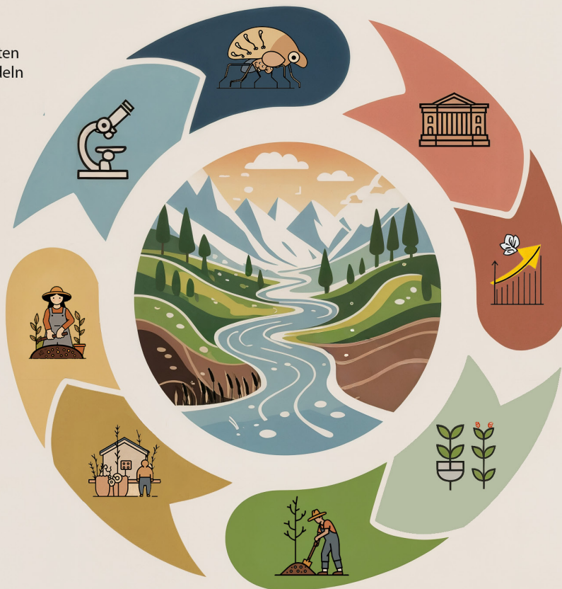
Abb. 3: © AI artwork by Joshua D. Lim