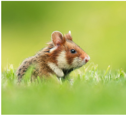
Abb. 7: Feldhamster.