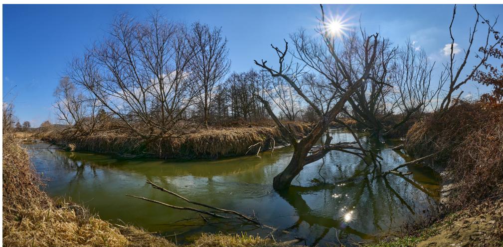
Abb. 4: Lafnitzauen.