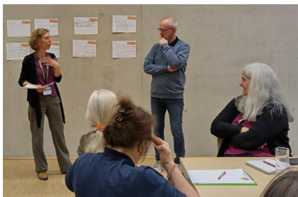
Abb. 2: Workshop auf den Tagen der Biodiversität 25.