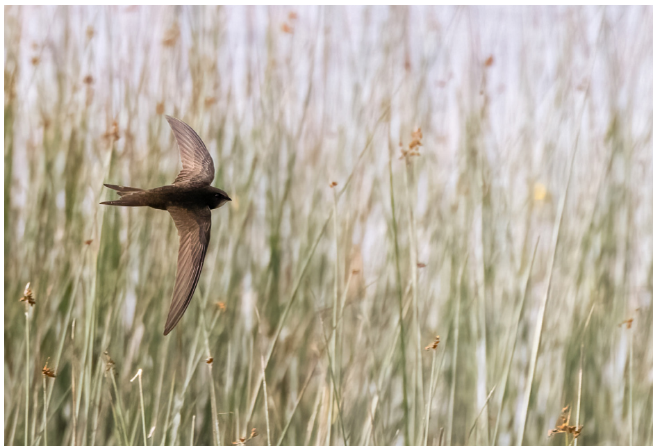
Abb. 8: Mauersegler.